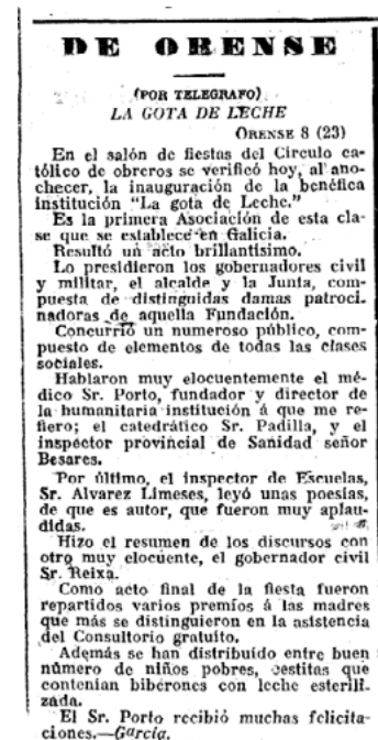
Ilustración 2: "De Orense: La Gota de Leche", La Voz de Galicia, 9 de abril de 1912.